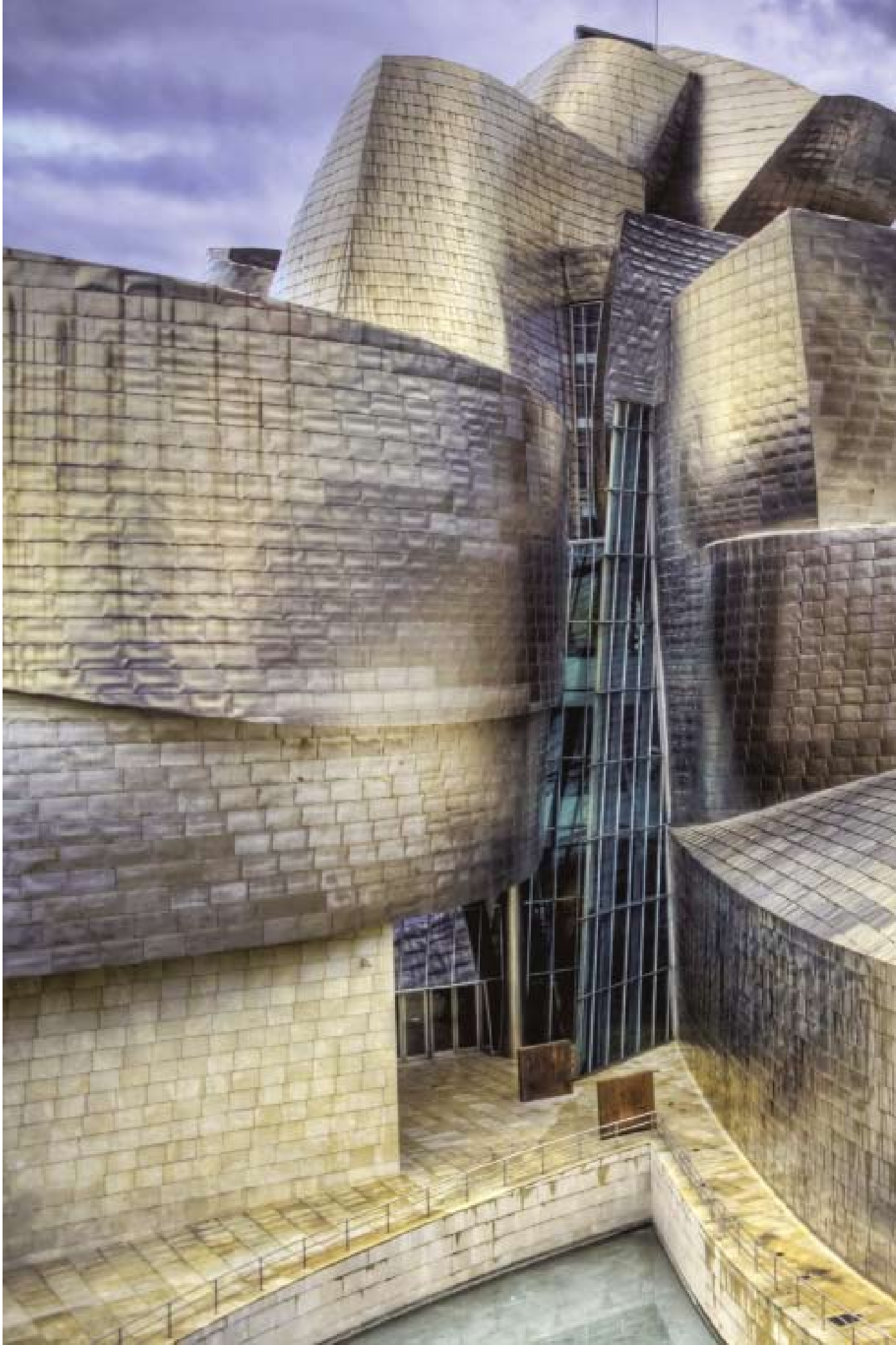
Guggenheim Museum i Bilbao ritat av Frank O. Gehry