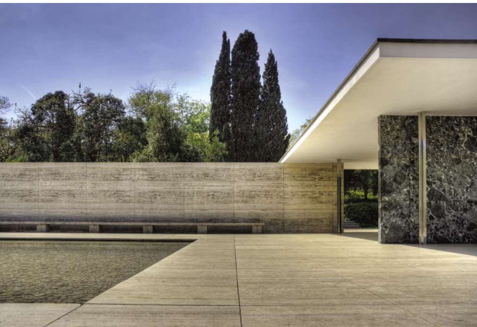
Tysklands paviljong på världsutställningen i Barcelona ritad av Ludwig Mies van der Rohe