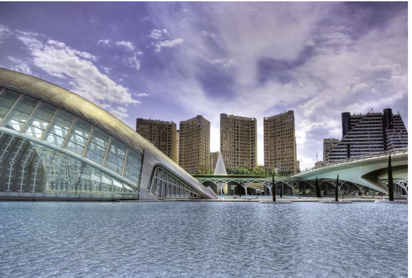
City of Arts and Science i Valencia ritat av Santiago Calatrava