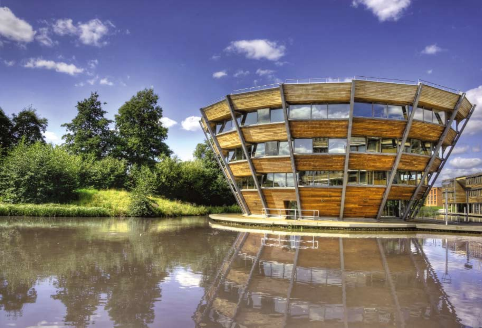
Djanogly Learning Centre, Nottingham av Michael Hopkins