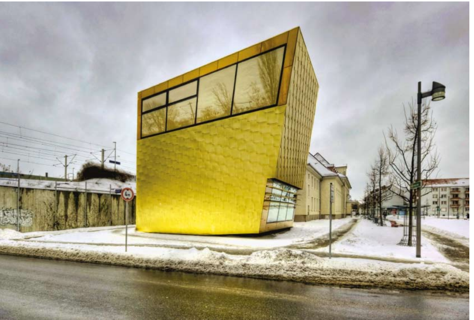
Biblioteket i Luckenwalde, av FF Architekten och Martina Wronna