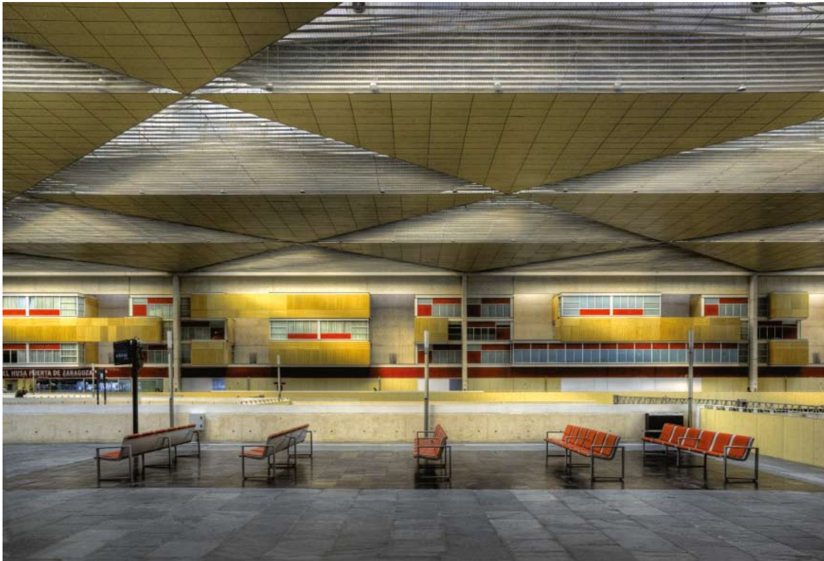
Zaragoza Delicias Station av Carlos Ferrater